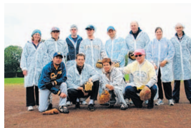
Honk en softbalvereniging de Houten Dragons houdt op 31 maart en 1 april hun traditionele openingsweekend. Dat weekend gaat de poort open voor alle Houtenaren.